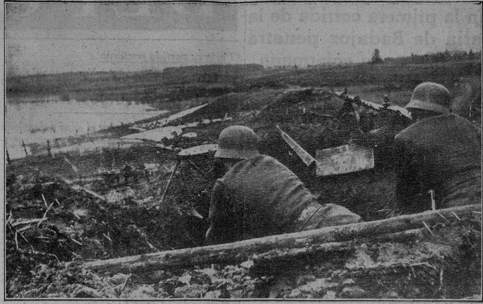
Esta es una posición de una de las famosas cabezas de puente empleadas por el Ejército del Reich para la más fuerte defensa de sus líneas en el frente del Este. Los centinelas están alerta para cualquier eventualidad mientras la cabeza de puente va siendo reforzada cada vez más.