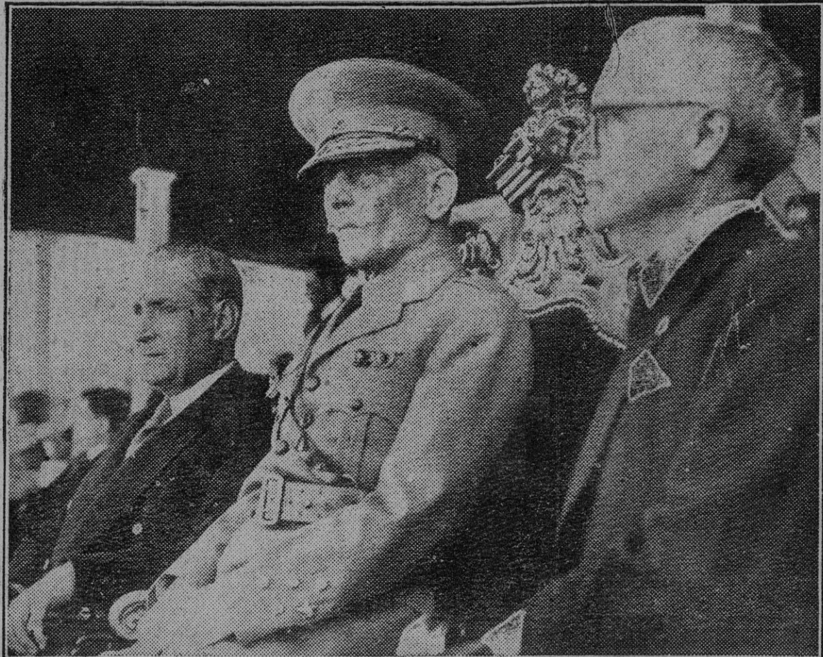
En el XVII aniversario de la revolución nacional portuguesa se celebraron diversos actos, a los que asistió el Jefe del Estado, general Carmona, a cuya derecha aparece en la fotografía el Presidente del Consejo de Ministros, Oliveira Salazar.