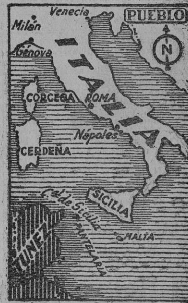
Se indica esta posibilidad, lo cual permite deducir el propósito de que la opinión pública italiana se familiarice con tal desarrollo y se prepare para los acontecimientos correspondientes. De consiguiente, es de que, en efecto, se intentará un desembarco en territorio italiano, no constituiría en absoluto ninguna sorpresa. El concepto general es que la iniciativa para la realización de este (Continúa en la página cuarta.)

Añade el ministro que los discursos pronunciados en las sesiones contribuyeron esencialmente a dilucidar los problemas que agitan hoy a la opinión pública europea. El ministro de Cultura Popular de Italia, Folivelli, ha enviado igualmente un despacho, en el que expresa al Congreso sus cordiales saludos. Al Congreso han asistido representantes de Alemania, Italia, España, Rumania, Hungría, Bulgaria, Croacia, Eslovaquia, Noruega, Francia, Japón, Bélgica, Holanda, Suecia, Suiza, Dinamarca, Lituania, Estonia, Albania, Grecia y Servia.