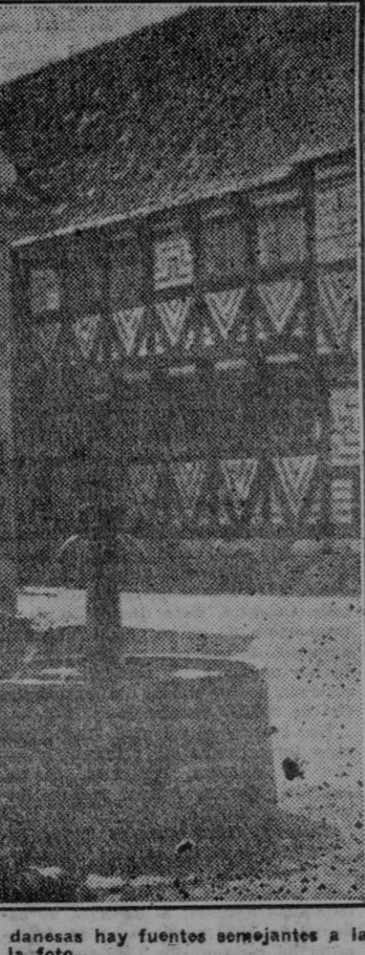
En la plaza de todas las aldeas danesas hay fuentes semejantes a la de la foto.

La consecuencia se dejó ver inmediatamente. El día 23 de dicho mes se realizaron las elecciones dentro del mayor orden y de la calma más completa y se comprobó que