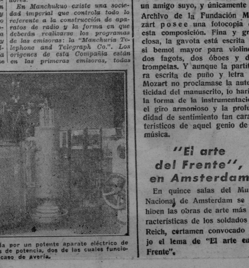
La emisora de radio está servida por un potente aparato eléctrico de cuatro válvulas de 300 kilovatios de potencia, dos de las cuales funcionan en caso de avería.

"El arte del Frente", en Amsterdam En quince salas del Museo Nacional de Amsterdam se exhiben las obras de arte más características de los soldados del Reich, certamen organizado bajo el lema de "El arte en el Frente".