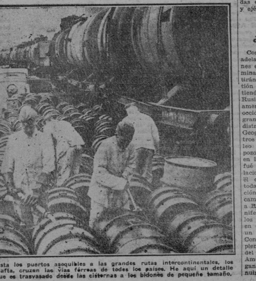
Desde los manantiales de origen hasta los puertos acopiados a las grandes rutas intercontinentales, los vagones cisternas, con la preciosa nafta, cruzan las vías férreas de todos los países. He aquí un detalle del aprovisionamiento del petróleo, que es trasvasado desde las cisternas a los bidones de pequeño tamaño.

grandes "trusts" interesados en el mercado llegaron pronto a acuerdos más o menos leales, más o menos voluntarios, pero siempre efectivos. La máxima efectividad de estos Convenios internacionales los podemos situar a partir de 1930. ¿A qué se debió el fenómeno? Sencillo, por aquella época los "trusts" del caucho que más o menos directamente están ligados con los del petróleo a través de una espantosa crisis no ivada por la competencia de precios y de producción que han mantenido. Es un hecho declarado que las naciones que han concedido al comercio exterior la importancia que en la economía se merece poseen al lado de los buques destinados al transporte de mercancías un tonelaje privativo del petróleo conocido con el nombre de flota petrolífera. En lo que respecta al petróleo, hay que considerar dos sistemas o procedimientos económicos: el de los que adquieren refinado y preparado, por tanto, para los distintos usos y el de aquellos que lo compran en bruto, disponiendo, por tanto, de las instalaciones y refinarias apropiadas para