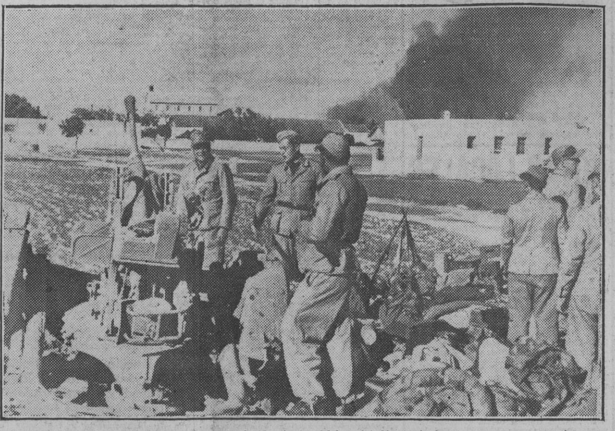
Las brigadas de trabajo de la organización Speer en Africa del Norte luchan como sus camaradas combatientes contra el enemigo. En la foto, un grupo de estas brigadas al cargo de una pieza de artillería antiaérea.