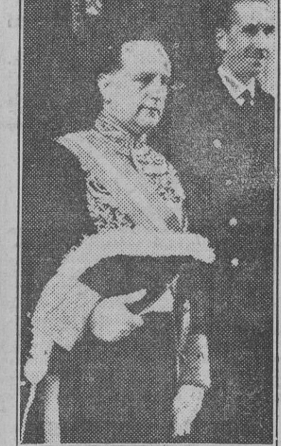
Nuestro embajador en Roma, camarada Raimundo Fernández Cuesta, ha presentado recientemente sus cartas credenciales al Rey Emperador. Aquí aparece en el momento de salir del Palacio del Quirinal después de la ceremonia.

El 6 de enero de 1943, precisamente el día de nuestra Pascua militar, se celebró en la carretera general de Moscú a San Petersburgo el acto de imponer 55 Cruces de Hierro a otros tantos componentes de la División Azul española por su valiente actuación en el asalto del 29 de diciembre.