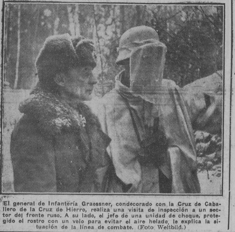
El general de Infantería Graessner, condecorado con la Cruz de Caballero de la Cruz de Hierro, realiza una visita de inspección a un sector del frente ruso...