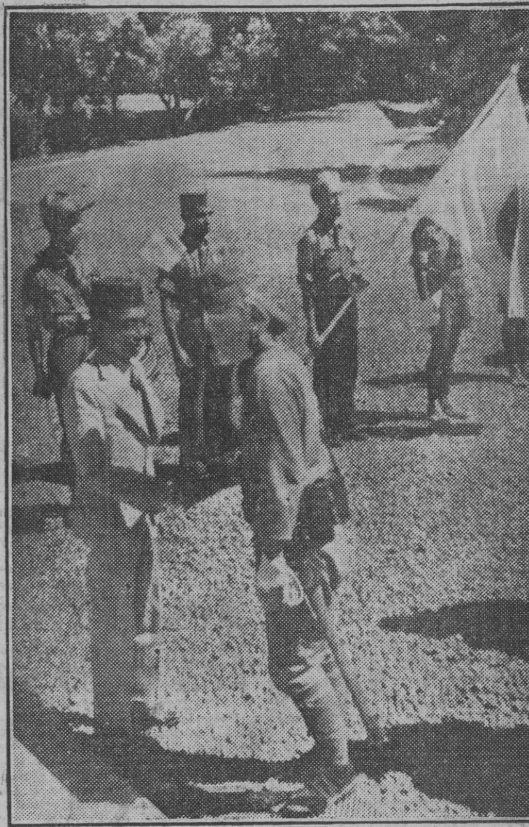
Un sultán de las Indias Orientales saluda al jefe de las fuerzas japonesas de ocupación durante una fiesta militar organizada por estrechar lazos con la población.