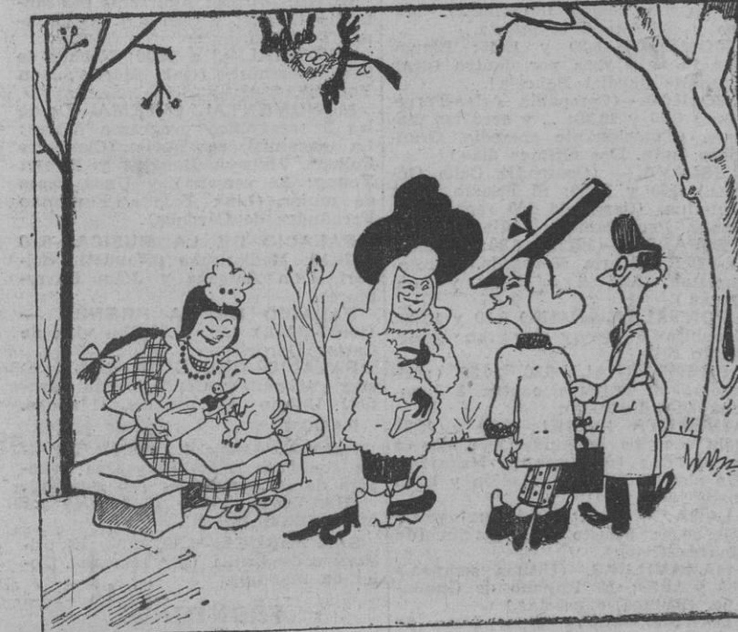
Vanidad, por Bellón

BUENOS AIRES, 16.—Por primera vez desde hace muchos meses ha entrado en el puerto de Santa Fe un buque europeo; se trata del barco español "Apolo".