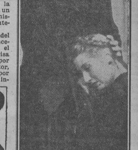
Rara vez se consigue en un film un conjunto de actores como el que se ha reunido en "Medianoche". En