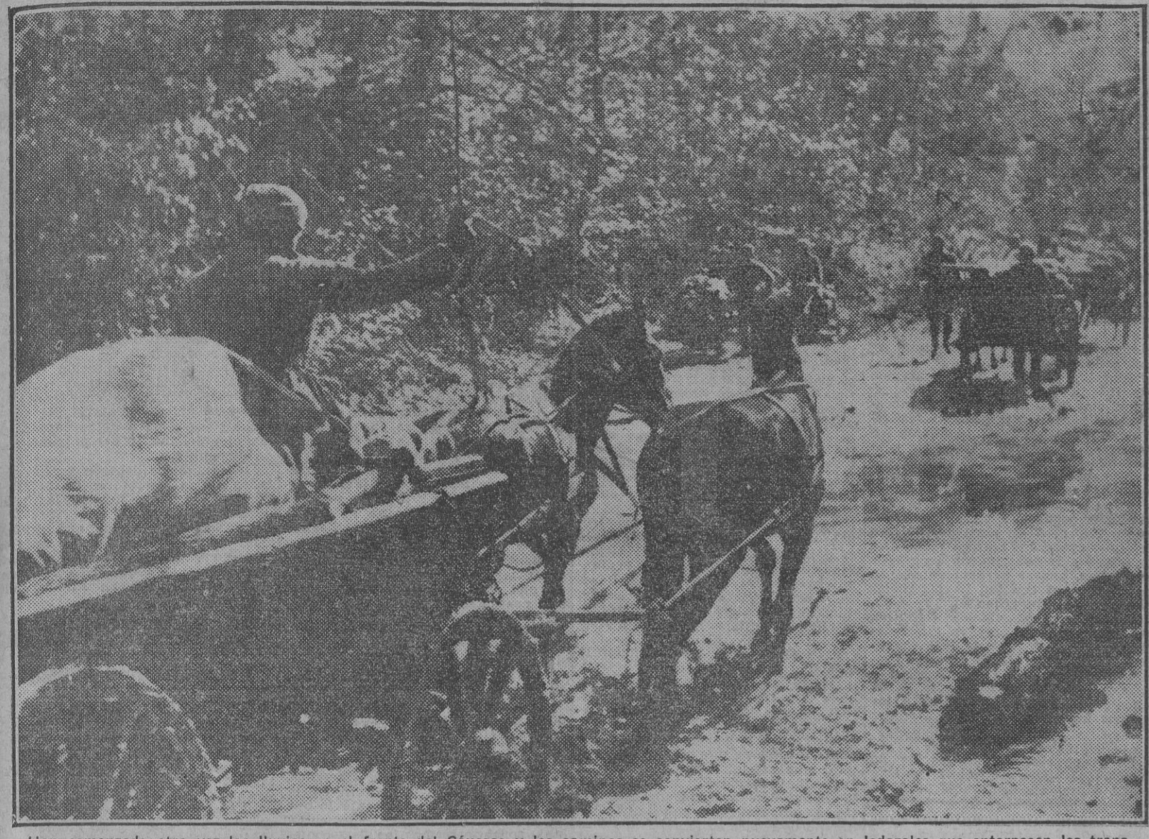
Han comenzado otra vez las lluvias en el frente del Cáucaso y los caminos se convierten nuevamente en lodazales que entorpecen los transportes militares. A pesar de ello, los suministros de víveres y municiones no se demoran un momento y los convoyes llegan siempre hasta las mismas líneas avanzadas alemanas.