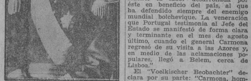
Felicitación de Hitler. GRAN CUARTEL GENERAL DEL FUHRER, 24.—El Führer ha cursado al general Carmona, jefe del Estado portugués, un telegrama de felicitación, concebido en términos cordiales, con motivo del setenta y tres cumpleaños del jefe del Estado portugués. (Efe.)

BERLIN, 24.—Con motivo del cumpleaños del general Carmona, jefe del Estado portugués, los diarios alemanes de esta mañana ponen de relieve la vida y la obra del hombre de Estado portugués. Unánimemente destacan todos los periódicos que el general Carmona ha logrado conservar estrictamente la neutralidad de su país en la guerra actual. El "Deutsche Allgemeine Zeitung" hace observar que con el advenimiento de Carmona a la Presidencia portuguesa esta nación ha entrado en una nueva fase de su historia. "Con frecuencia—añade el periódico—el pueblo portugués ha tenido ocasión de agradecer a su Presidente la labor desarrollada por éste en beneficio del país, al que ha defendido siempre del enemigo mundial, habiendo visto la veneración que Portugal testimonia al jefe del Estado se manifestó de forma clara y terminante en el mes de agosto último cuando el general Carmona regresó de su visita a las Azores y, en medio de las aclamaciones populares, llegó a Belem, cerca de Lisboa." El "Voelkischer Beobachter" declara por su parte: "Carmona, hombre de Estado y militar, ha considerado su deber no abandonar en los tiempos difíciles las funciones que para él constituirían una carga pesada." El "Berliner Lokal Anzeiger" "Portugal considera a Carmona como la encarnación de su voluntad de vivir en pie de igualdad con las demás naciones." (Efe.)