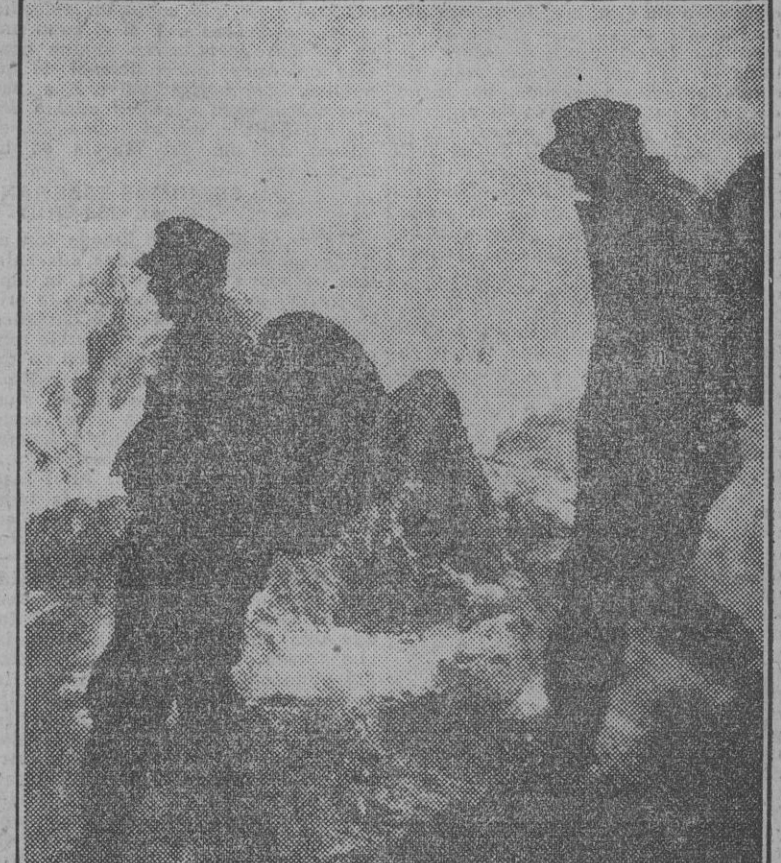
Fuerzas alpinas alemanas en las elevadas cumbres caucásicas, donde ondea la bandera del Reich.