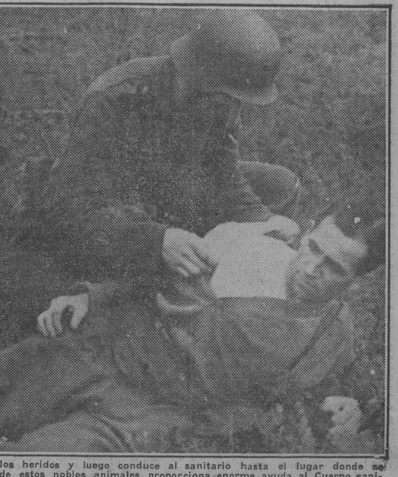
El perro de San Bernardo busca a los heridos y luego conduce al sanitario hasta el lugar donde se hallan. La inteligencia y abnegación de estos nobles animales proporciona enorme ayuda al Cuerpo sanitario alemán.