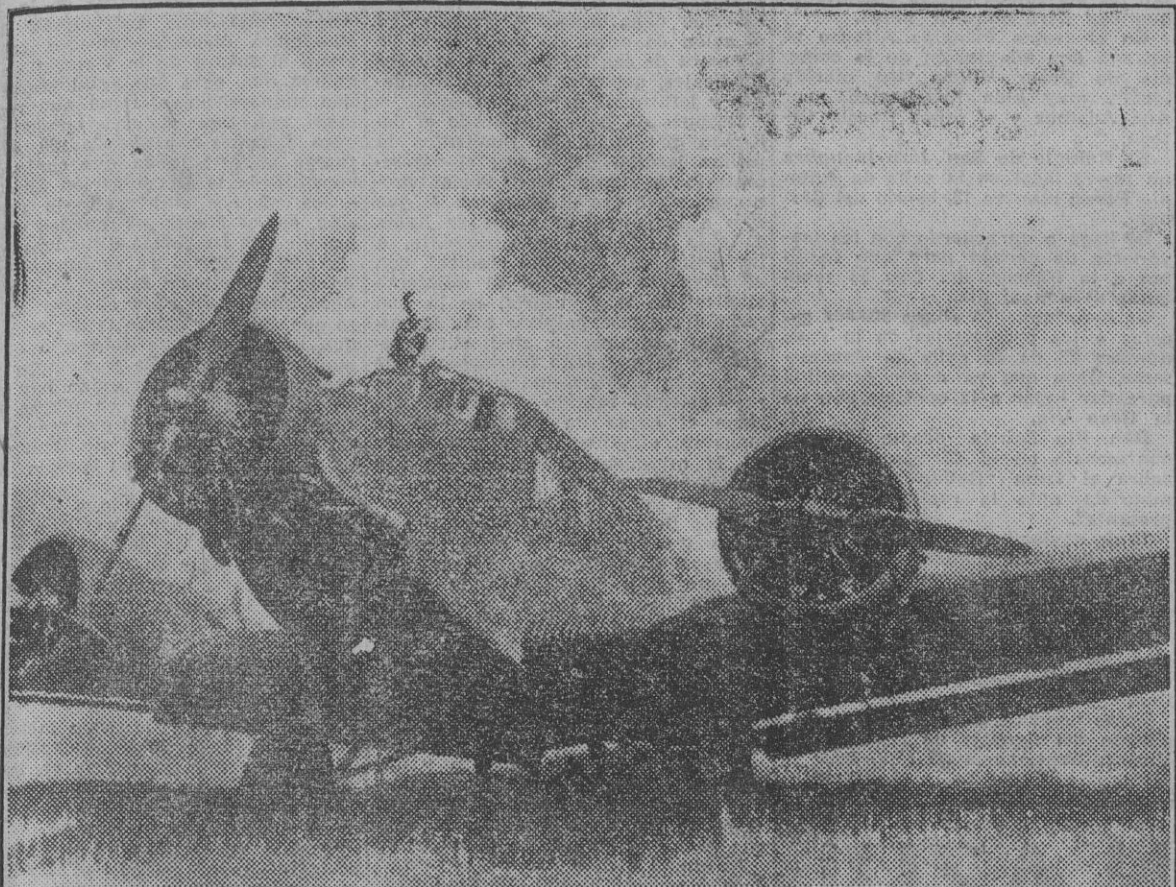
Un aparato "Ju-52" preparado para partir y arrojar su carga sobre los nidos de resistencia de los Soviets.