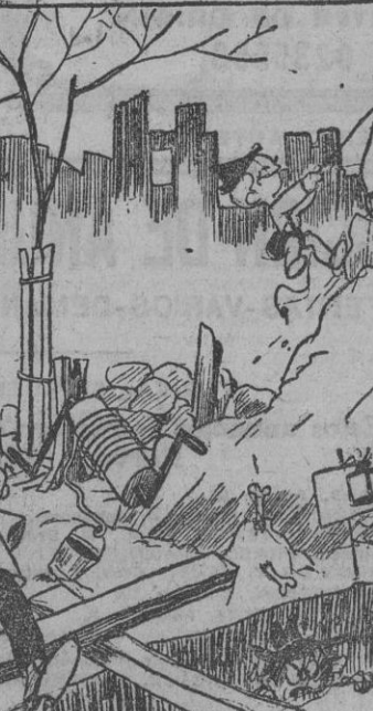
¡ESAS CALLES, por Bellón —Mis niños no echan de menos la tierra y el alpinismo. ¡Todas las tardes los traigo unas horitas a las calles céntricas de Madrid!

Transporte hundido por un submarino alemán BERLIN, 17.—El comunicado alemán de hoy dice: "En Cireneica continúan los combates, Derna ha sido evacuada, conforme al plan establecido, por las tropas germanoitalianas. Los bombarderos han luchado eficazmente contra las columnas británicas."