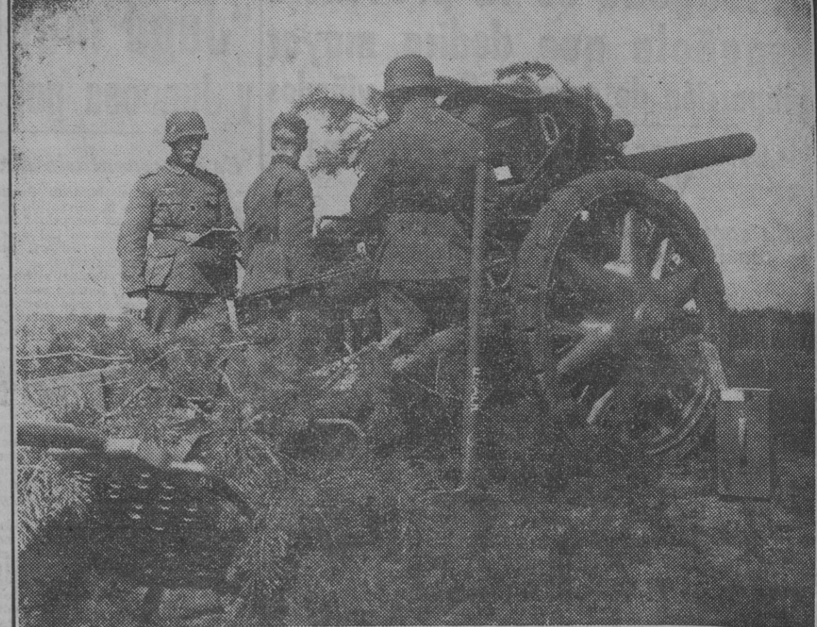
El avance de los soldados alemanos en el frente meridional de Rusia tiene un poderoso auxiliar en la artillería, que, desde todos los puntos, "machaca" sistemáticamente las posiciones soviéticas...