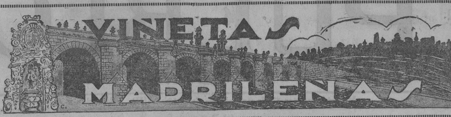
MADRID. EL PUEBLO