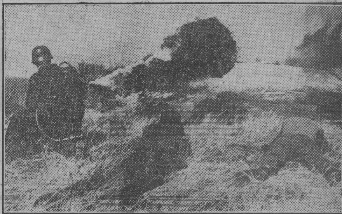
Un grupo de soldados provistos de lanzallamas avanza a la conquista de un fortín.