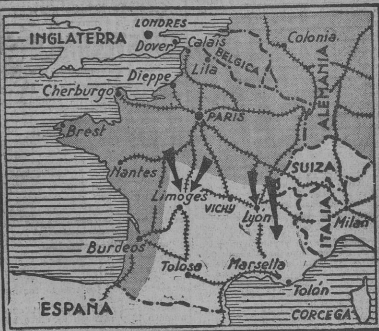
En el gráfico se aprecian las dos zonas en que hasta ahora estuvo dividida Francia por virtud del armisticio de 1940. Las tropas del Eje han pasado la línea de demarcación y avanzan hacia la costa del Mediterráneo para organizar su defensa contra los posibles intentos aliados de invasión.

Tropas italianas colaboran con las alemanas en la ocupación de Francia ROMA, 11. (Urgente).—Oficialmente se anuncia que las tropas italianas han entrado esta mañana en la zona libre francesa al mismo tiempo que las fuerzas alemanas.