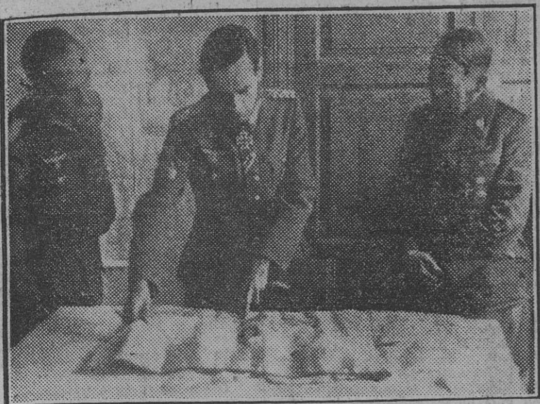
El jefe de la gloriosa División Azul ha recibido una bandera bordada por las mujeres argentinas para los heroicos voluntarios españoles. Aquí aparece conferenciando sobre el plano de operaciones con uno de sus ayudantes y un jefe alemán.