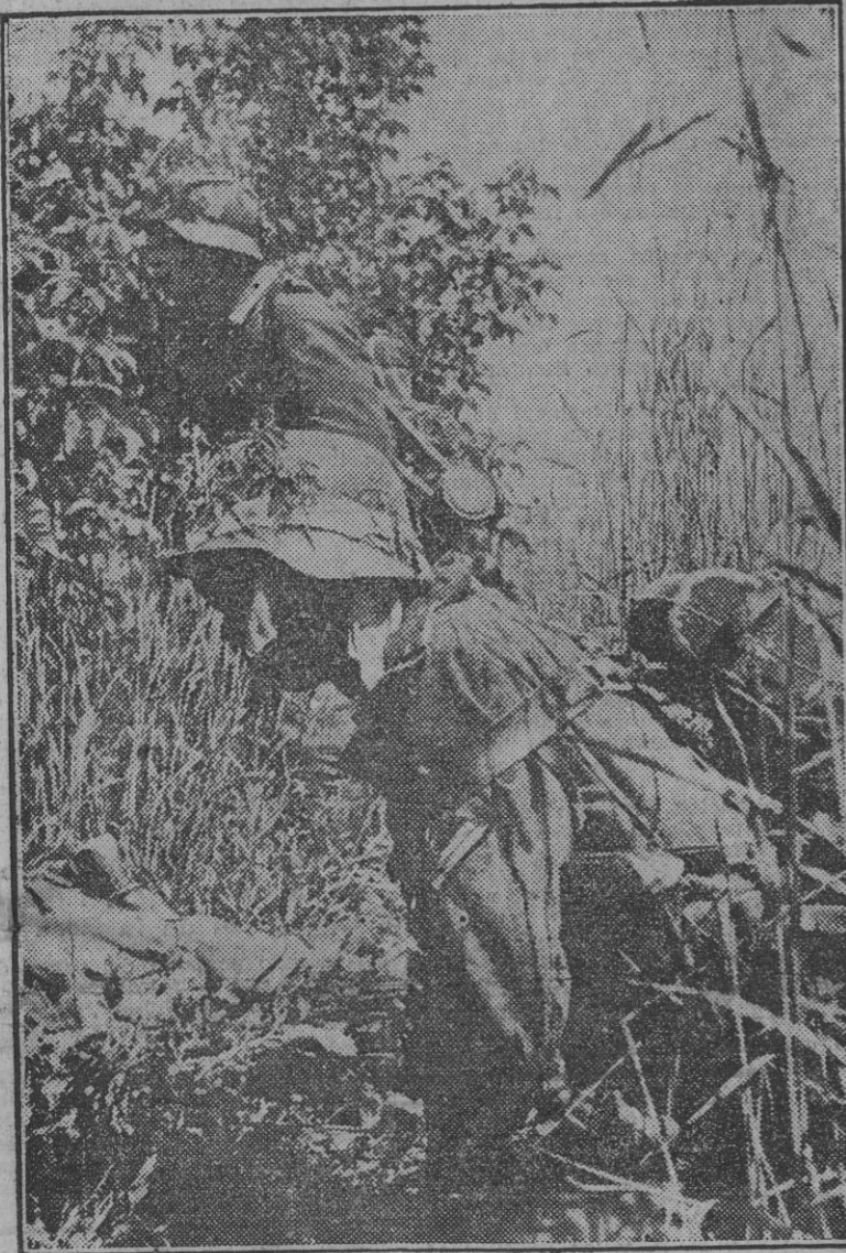
El soldado alemán emplea, a la vez que sus modernas armas, todos los medios imaginables para conseguir el éxito de sus acciones. He aquí a dos infantes de las tropas alemanas con los cascos camuflados para avanzar entre el follaje.