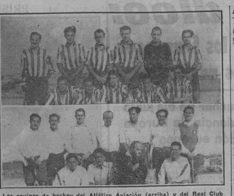
Los equipos de hockey del Atlético Aviación (arriba) y del Real Club de Campo (abajo), vencedores del Padilla y del S. E. U. de Caminos...