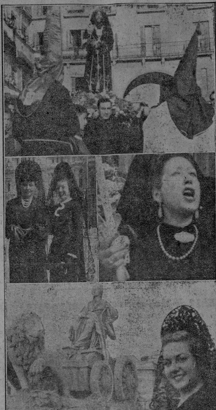
Estampas permanentes de esta semana. Imágenes de la Pasión. Nazarenos encapuchados. Mantillas. Vozes doloridas que claman «¡sacetas!»