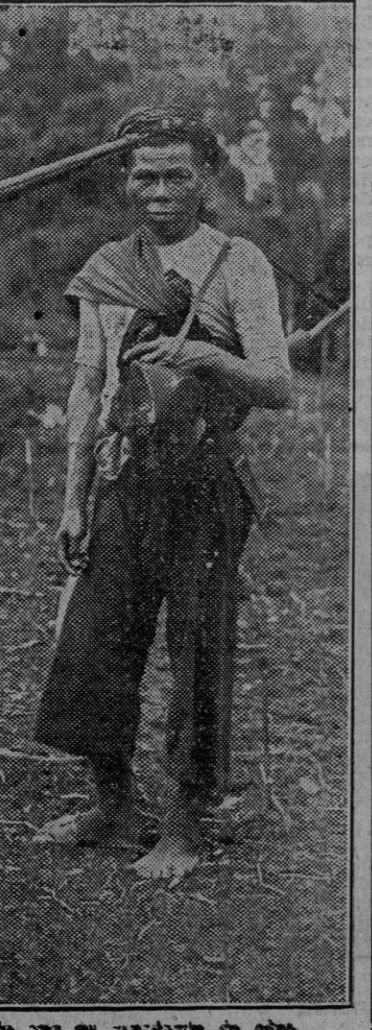
Un viejo cazador de elefante...