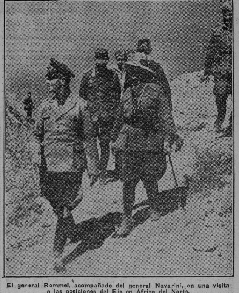
El general Rommel, acompañado del general Navarini...