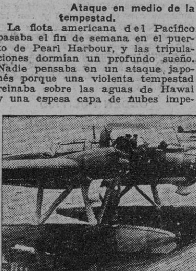
Ataque en medio de la tempestad.

La Flota americana del Pacífico pasó el fin de semana en el puerto de Pearl Harbor, y las tripulaciones dormían un profundo sueño.