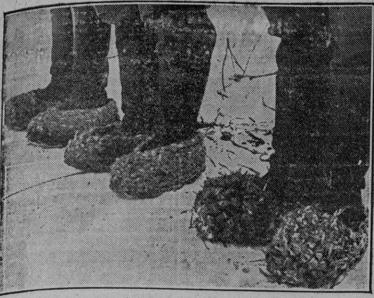
Estas botas desmesuradas no elegantizan el pie, pero lo mantienen caliente y cómodo en el suelo helado del frente ruso.