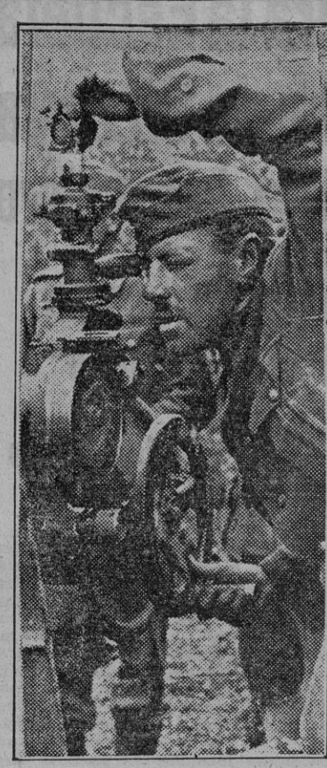
Este cameraman alemán es un valiente soldado del Ejército del Reich. Entre las bombas y el ruido del funcionamiento de su objetivo. Algunas veces las bombas caen tan encima que la máquina tomavistas queda hecha añicos. Gajes del oficio. (Foto Weltbild.)

En los centros técnicos alemanes se declara que toda la población del Este se apresura a incorporarse al trabajo, ya que a consecuencia de la pésima administración bolchevique, nada en el campo de las reservas dinerarias o de provisiones. En dichos centros se manifiesta la siguiente opinión: "El rendimiento de la capacidad económica rusa experimentará en el porvenir un cambio decisivo y radical, especialmente en lo que concierne a una producción creciente de artículos de consumo, materias primas y productos agrícolas." (Efe.)