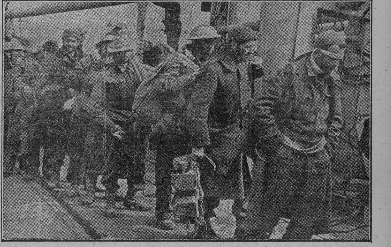
Una columna de prisioneros ingleses en el momento de embarcar con destino a Italia, donde serán concentrados.