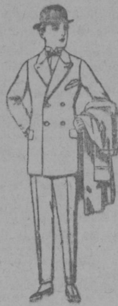
Trajes de patén, vicuña etc., para niños de 10 a 12 años de ptas. 35 a 80 Los mismos, para jovencitos de 13 a 16 años de ptas. 40 a 85