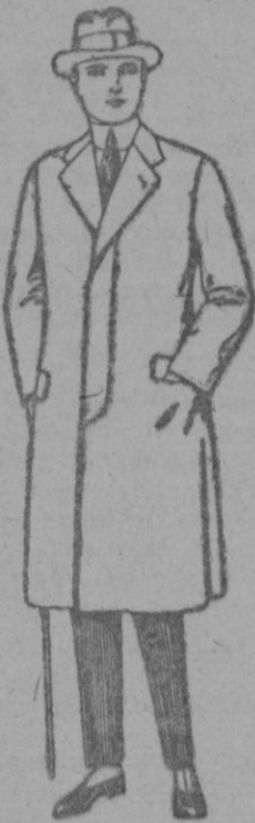
Gabanes de cheviot, gamuza, patén, etc. de ptas. 43 a 70