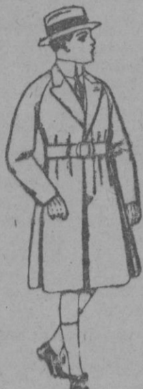
Gabanes de patén, para niños de 4 a 9 años de ptas. 30 a 58

Ropas confeccionadas para Caballero, Señora, Niño y Niña Gorras, Sombreros, Cinturones, Calcetines, Corbatas, Pañuelos, Fajas, Ligas, Tirantes, etc.