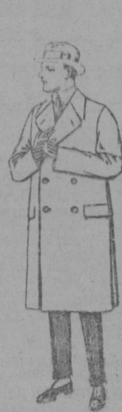
Gabanes de patén gamuza o cawer de ptas. 70 a 100