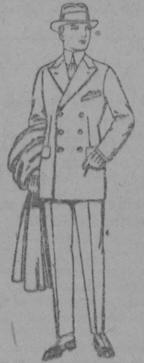
Trajes de cheviot, meltón vicuña o jerga de ptas. 55 a 150