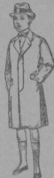
Gabanes de patén, para niños de 10 a 15 años de ptas. 22 a 90

PRECIO FIJO - Pídase el catálogo general - VENTAS AL CONTADO