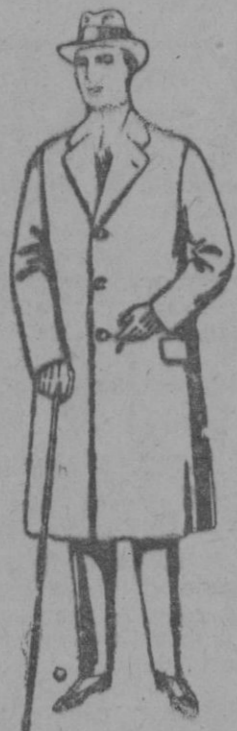
Gabanes de cheviot, gamuza, patén, etc. de ptas. 48 a 150