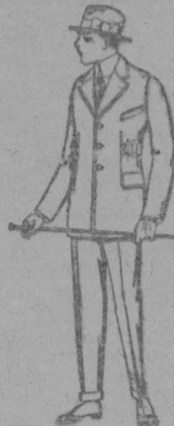
Trajes de patén, vicuña o jerga, etc., forma Sport, para niños de 10 a 12 años de ptas. 45 a 83 Los mismos, para jovencitos de 13 a 16 años de ptas. 48 a 85