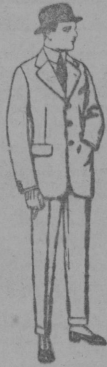
Trajes de cheviot, meltón, vicuña o jerga de ptas. 38 a 135

SUCURSALES: Madrid, Barcelona, Alicante, Almería, Bilbao, Cádiz, Cartagena, Gijón, Granada, Málaga, Santander, Sevilla, Valencia, Valladolid, Zaragoza.