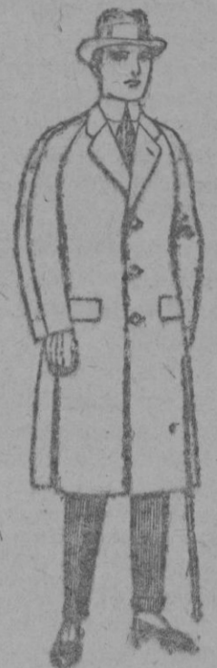
Gabanes de patén, meltón, o cheviot, con forro de seda, satén o escosés de ptas. 68 a 185