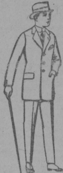
Trajes de patén, vicuña o jerga, para niños de 10 a 12 años de ptas. 30 a 78 Los mismos, para jovencitos de 13 a 16 años de ptas. 33 a 80