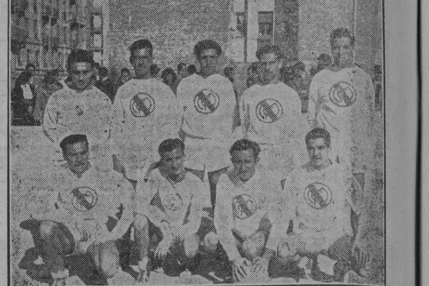
Equipo de baloncesto del Real Madrid que mañana por la mañana, en el "terreno" del frontón Iberia, se enfrentará a cinco del América. Se trata de la final del Trofeo Gol, que nuestro querido colega ha venido haciendo disputar con un éxito grande...