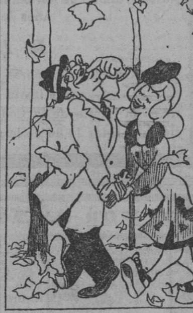
—¡Envidias! Le aseguro que el novio de mi hija es un chico de buena posición. ¡Usted verá! Le regala todos los días a mi niña una docena de castañas!

En el costado de este "Junker 88" se han marcado las dieciséis victorias obtenidas contra rusos e ingleses en el mar y en el aire. En la lista figuran catorce buques enemigos, con un tonelaje total de 65.500 toneladas. Las dos barras que el piloto señala con el dedo representan dos cazas abatidos. La nacionalidad del enemigo está indicada con un círculo por los ingleses y la estrella de cinco puntas para los soviéticos.