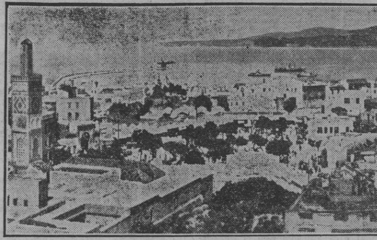
Vista de la bellísima bahía de Tánger, la ciudad en donde un día se dieron cita las pasiones internacionales y que hoy vive su vida honestamente bajo el mando del Caudillo, como una ciudad más de España.

¡Autoridad y trato cordial en la relación con organismos afines de otros países europeos!