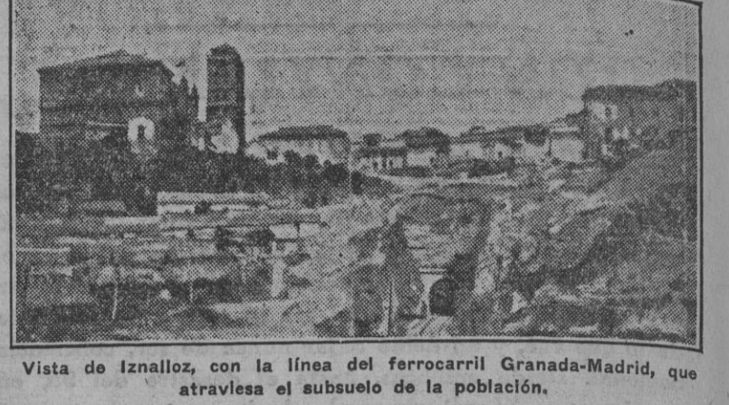
Vista de Iznalloz, con la línea del ferrocarril Granada-Madrid, que atraviesa el subsuelo de la población.