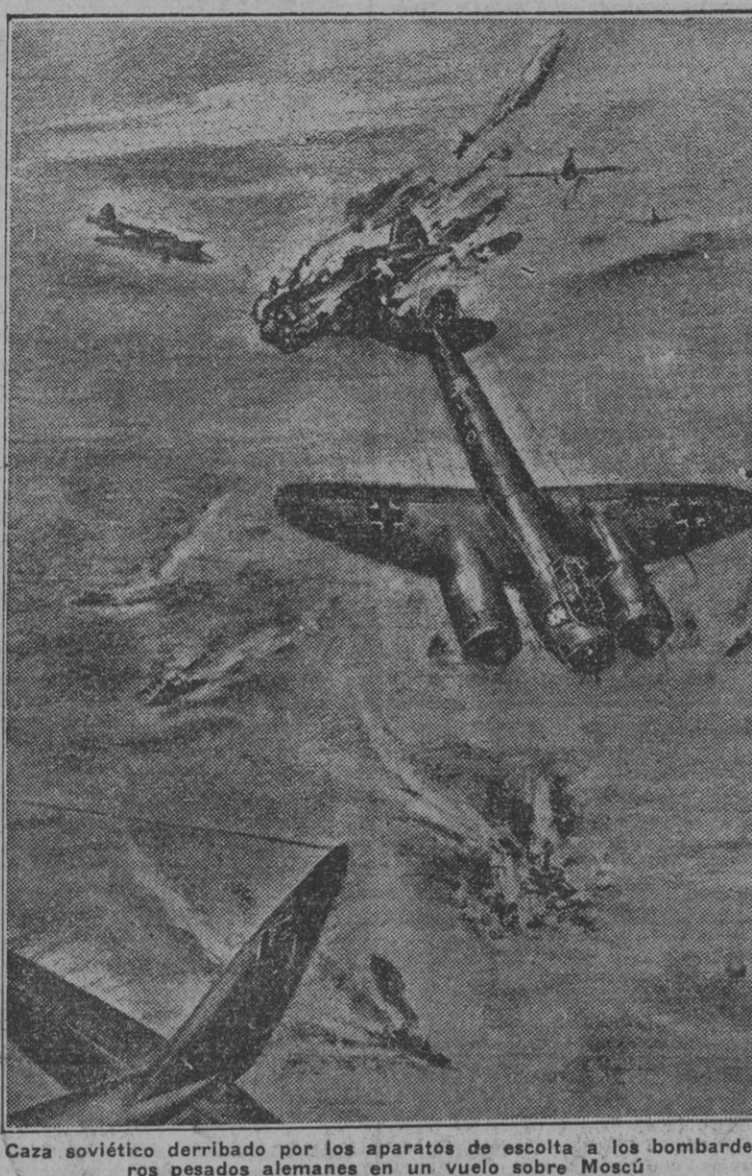
Caza soviético derribado por los aparatos de escolta a los bombarderos pesados alemanes en un vuelo sobre Moscú