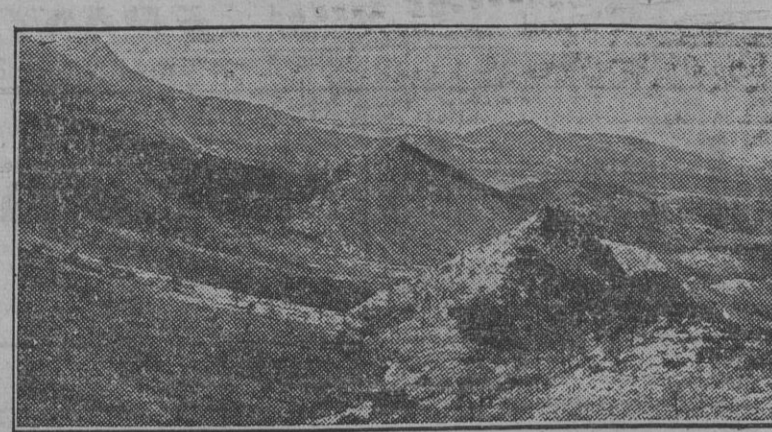
Vista general de Sierra Umbria, donde se están llevando a cabo importantes trabajos de repoblación forestal.