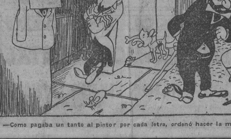
—Como pagaba un tanto al pintor por cada letra, ordenó hacer la muestra en fuga de vocales...