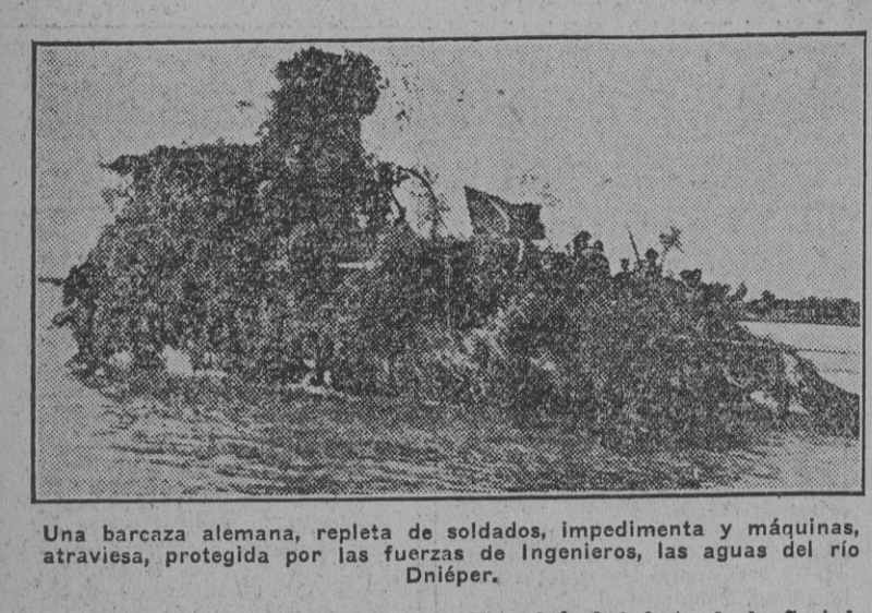
Una baronesa alemana, repleta de soldados, impedimenta y máquinas, atraviesa, protegida por las fuerzas de ingenieros, las aguas del río Danéper.

Por Umberto Guglielmotti, consejero nacional y director de "Tribuna", de Roma