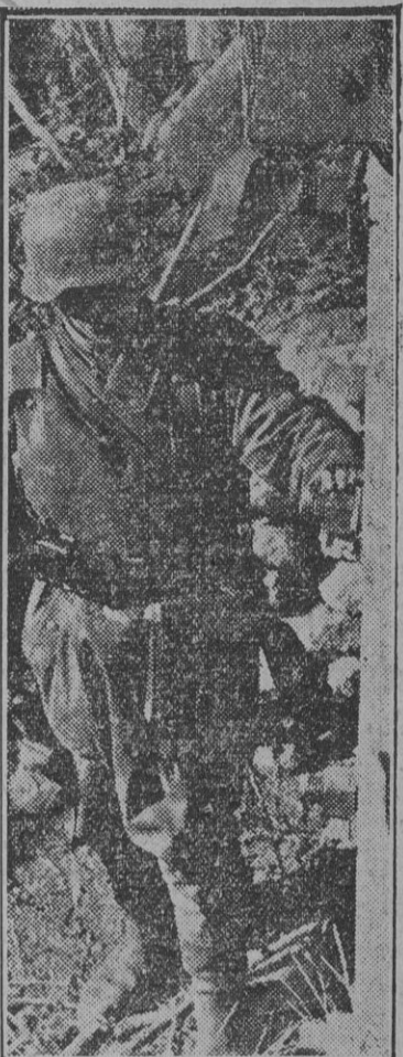
Cercanías de San Petersburgo conquistadas recientemente por las tropas del Reich tras largo castigo de la potente artillería alemana. La foto nos muestra un soldado de las fuerzas de choque comprobando el espesor de las planchas acorazadas, totalmente destruidas y que los rusos creyeron invulnerables a todo proyectil.