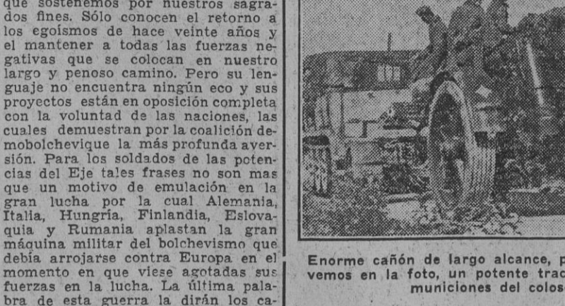
Enorme cañón de largo alcance, para cuyo arrastre se necesita, como vemos en la foto, un potente tractor, que es a la vez depósito de las municiones del cañón alemán.