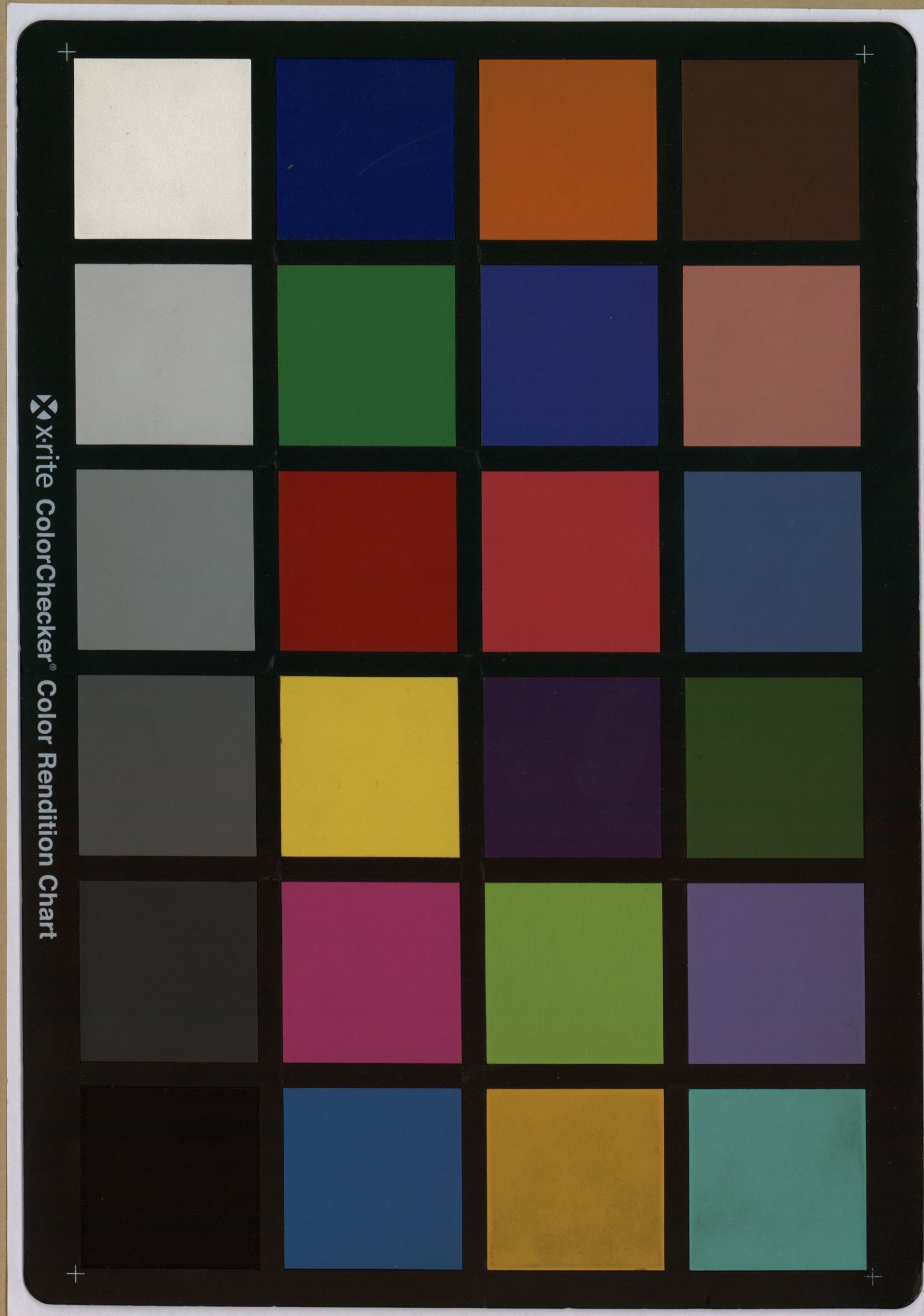
Xrite ColorChecker Color Rendition Chart