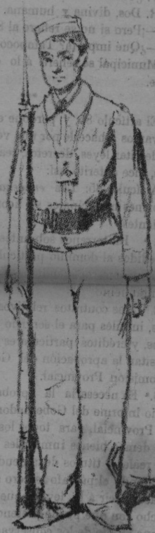
SOLDADO EN TRAJE DE CAMPAÑA