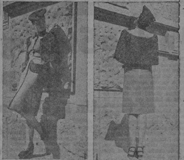
ANVERSO Y REVERSO DE UN SUGESTIVO CONJUNTO DE ENTRETIMIENTO, REALIZADO EN LANILLA Y ADORNADO CON CAPITA