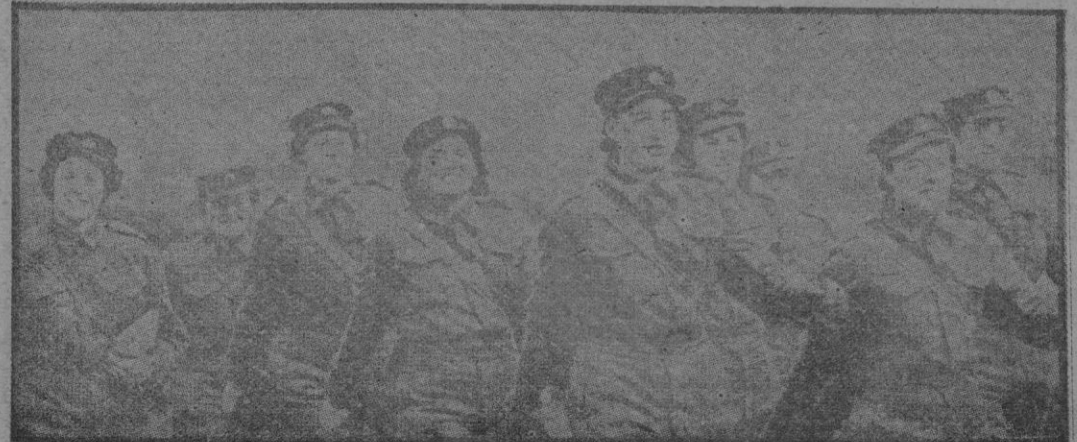
...SON LAS DE UN GRUPO DE MUJERES INGLESAS MIEMBROS DE LA A. T. S., QUE FORMAN PARTE DE UNA BATERIA EN LA SECCION OCCIDENTAL