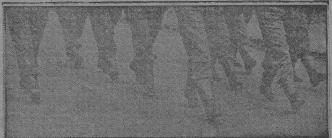
ESTAS MARCIALES PIERNAS DEBERIAN CORRESPONDER A UN PELOTON DE SOLDADOS; PERO NO...