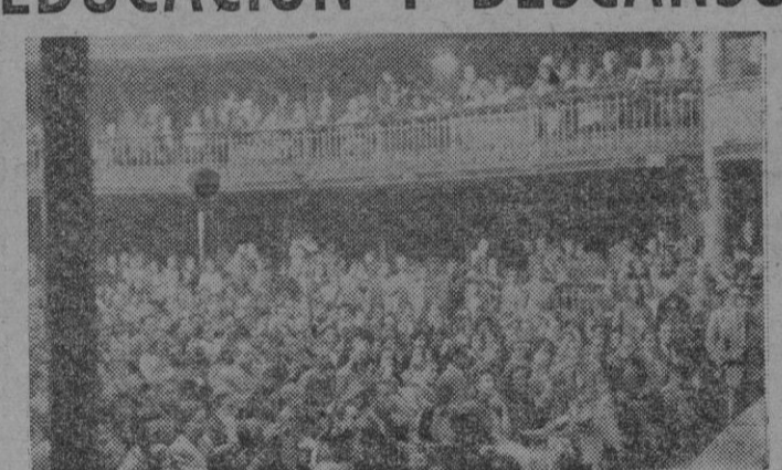
EL PASADO DIA 14 TUVO LUGAR LA SESION FINAL DEL CONCURSO DE CANTO ORGANIZADOS POR LA OBRA SINDICAL DE EDUCACION Y DESCANSO, CON LA COLABORACION DE RADIO MALLORCA Y ANUNCIOS MALLORCA. EL LIRICO, EN ESTA FUNCION REGISTRO EL LLENO MAS ABSOLUTO DE TODOS LOS TIEMPOS, SIENDO MAGNIFICOS LOS RESULTADOS ARTISTICOS DE LA FUNCION. «EDUCACION Y DESCANSO» LOGRO, A FUERZA DE INFATIGABLES LABOR, EL TRIUNFO SIN PRECEDENTES DE UN CONCURSO LIRICO EN MALLORCA. OFRECEMOS UN ASPECTO DEL TEATRO LIRICO EN LA FUNCION DEL JUEVES DIA 14.