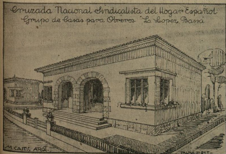
Aspecto del hermoso chalet que muy en breve se comenzará a construir en el solar que nos ha regalado la "Urbanización AMANECER"