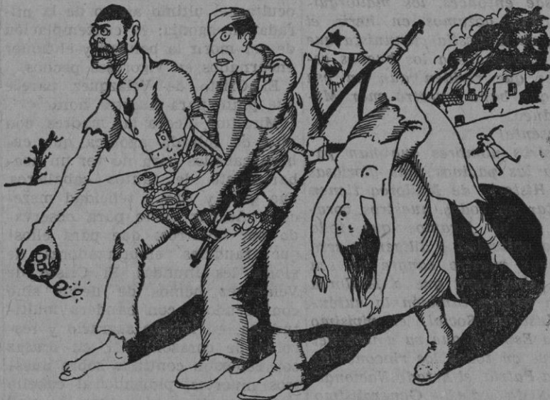
Los defensores de la Igualdad, Libertad y Fraternidad pasean sus trofeos.

Por otra parte, en el reciente Congreso anual de la Asociación de Amigos de la URSS, el Secretario del Partido socialista suizo pronunció un discurso en el que expresó la solidaridad de su partido con los «Amigos de la URSS». («Freiheit» 26-6-37; «La Lutte» núm. 19-1937).