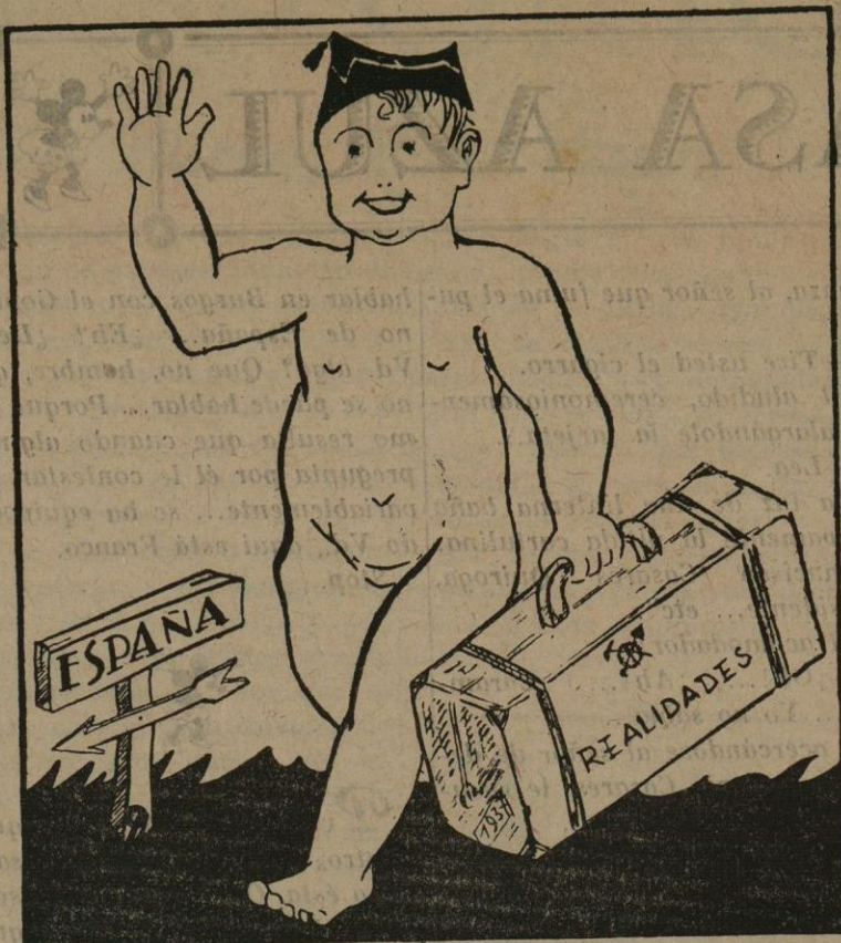
OBREROS! Lo que nos trae el Año nuevo!

La propiedad privada, fruto del trabajo acumulado, no puede ser reprobada siempre que cumpla la función social que le corresponde. Lo que no puede subsistir es el capitalismo antagónico a ese sentido de armonía, que ocasiona con su absorción completa del modesto trabajo y de la modesta propiedad, todo el desequilibrio moral y económico, base de la injusticia y de la iniquidad.