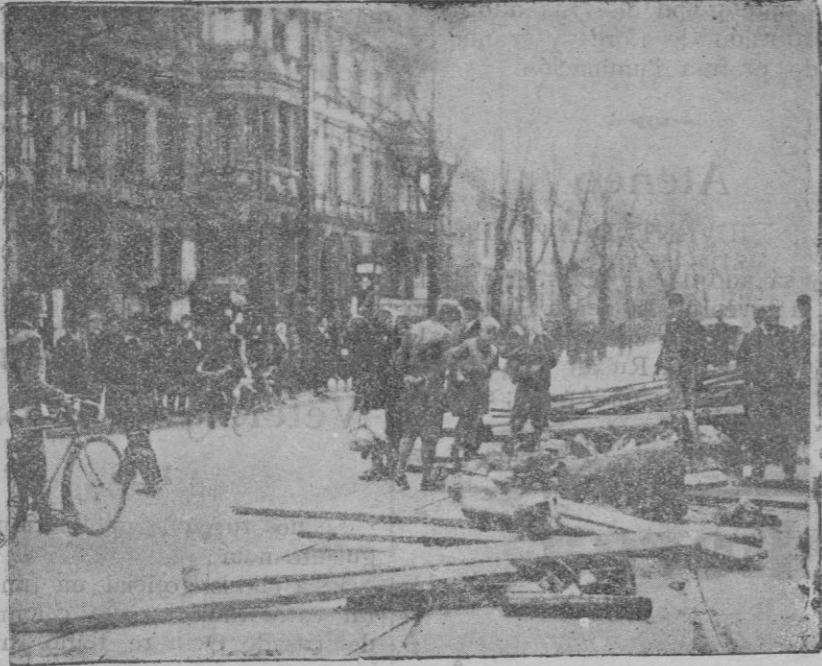
Aspecto que ofrecían las calles de Berlín llenas de obstáculos colocados por los huelguistas para impedir la circulación