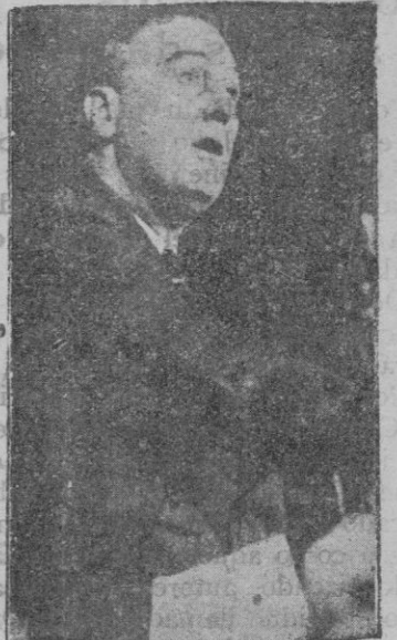
Mr. Roosevelt en el momento de pronunciar un discurso

En contra de la opinión de los médicos, ella proclamó, con extraña seguridad, que su marido curaría de la grave dolencia que le aquejaba y que volvería a ocupar pronto su puesto en el mundo político, siguiendo la ascensión de su carrera hasta el límite supremo.