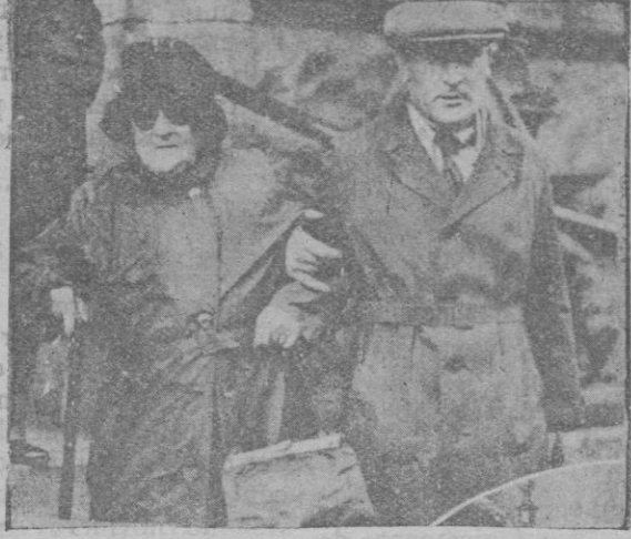
Como diputado de más edad, se asegura que será elegida para presidir la sesión inaugural del Reichstag la comunista Clara Teikin que cuenta 75 años de edad