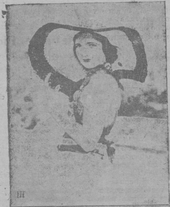
La moda parisién de los sombreros parasoles. La vedette Miss Kay Francis, con uno de esos grandes sombreros de paja en el último film que acaba de impresionar