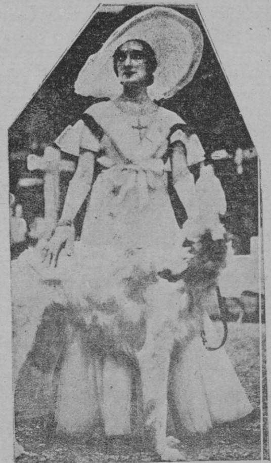
Uno de los últimos modelos