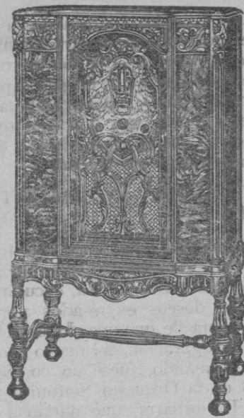
ONDA CORTA y LARGA