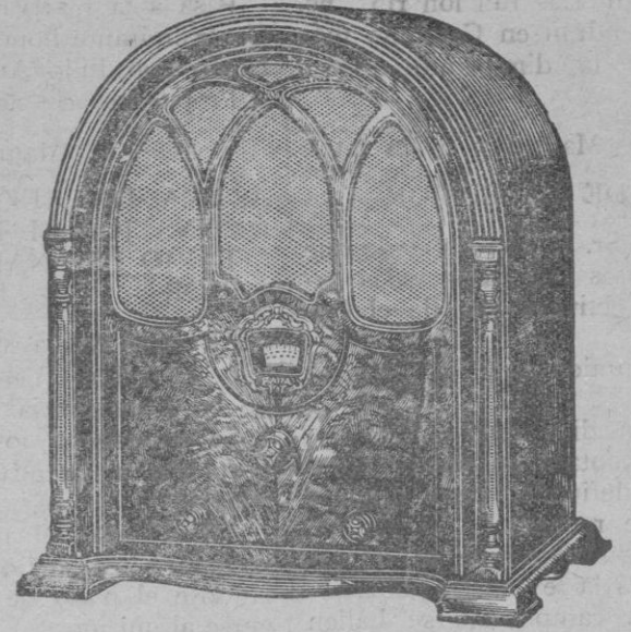
ONDA CORTA y LARGA

Un solo mando directamente a la corriente alterna Control de tono gran selectividad Demostraciones a solicitud