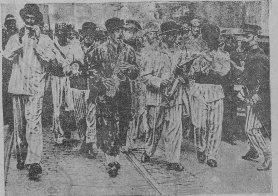
Los estudiantes londinenses, para una postulación benéfica, organizaron, a iniciativa de uno de ellos, español, una banda a imitación de la del Empastre, y así recorrieron las calles logrando una saneada recaudación