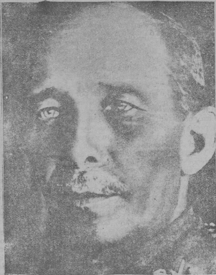
El ex-capitán general de Cataluña, don Emilio Barrera, que ha sido detenido y encarcelado