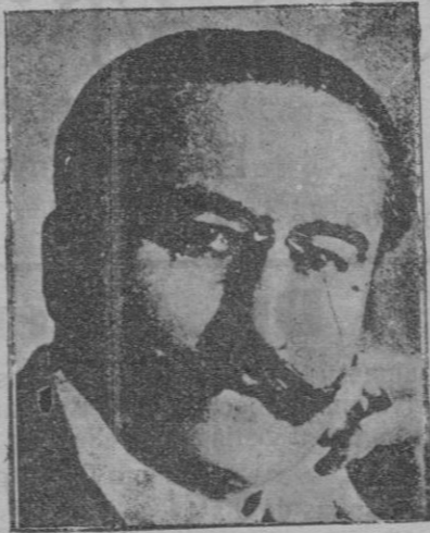
El señor Vaida Vaevet, que acaba de formar Gobierno