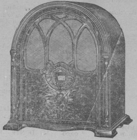
ONDA CORTA y LARGA

Un solo mando directamente a la corriente alterna Control de tono gran selectividad Demostraciones a solicitud