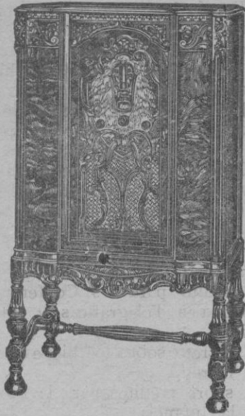
ONDA CORTA y LARGA