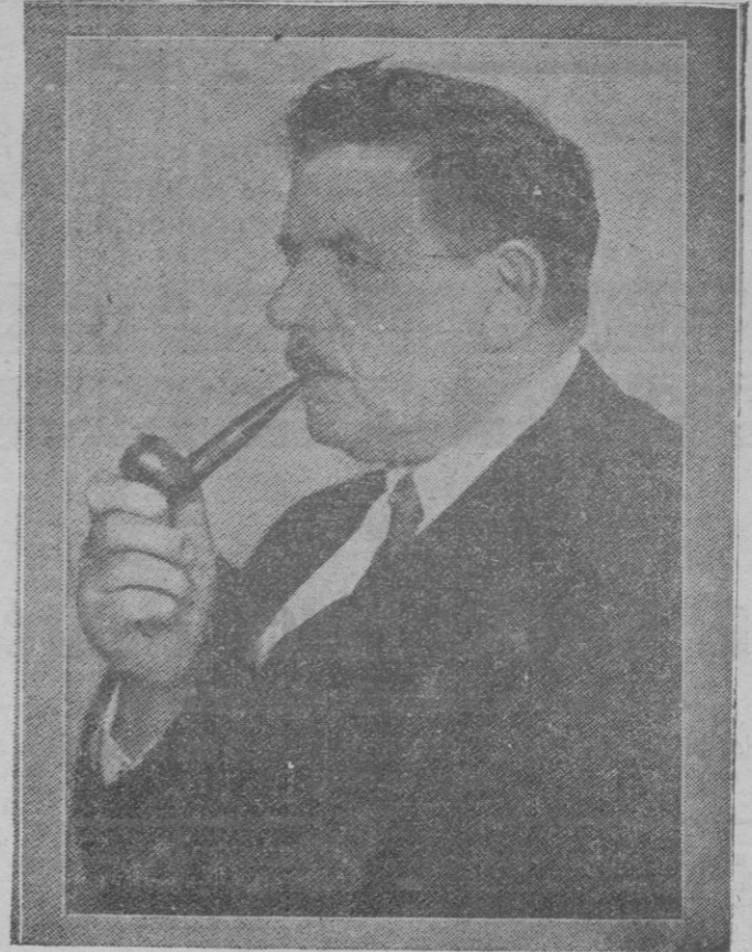
El nuevo jefe del Gobierno francés

que nadie sabe quien es, de donde viene, ni a donde vá; y que de vez en cuando acude a aquellos lugares a hacer brotar lágrimas furtivas en aquellas gentes endurecidas por el crimen, el atraco y toda clase de violencia, lo cual prueba que también la gente de bronce tiene su corazoncito y lágrimas en los ojos, como decía el festivos sainetero.