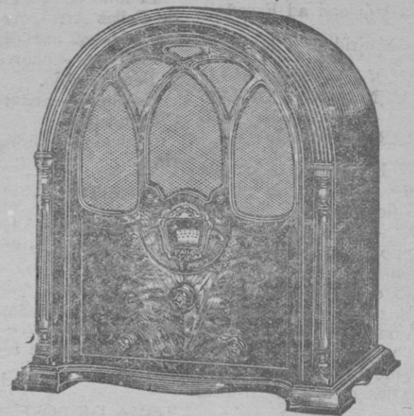
ONDA CORTA y LARGA

Un solo mando directamente a la corriente alterna Control de tono gran selectividad Demostraciones a solicitud