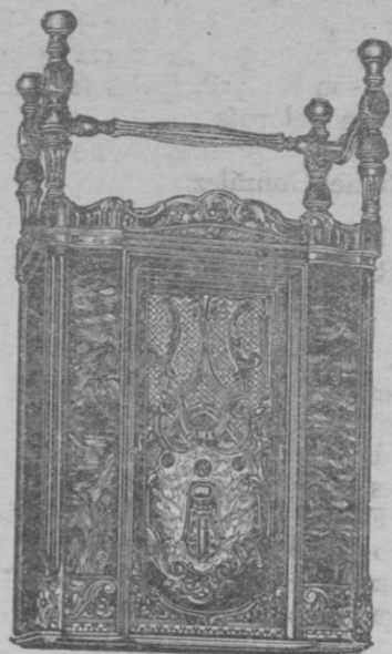
ONDA CORTA y LARGA