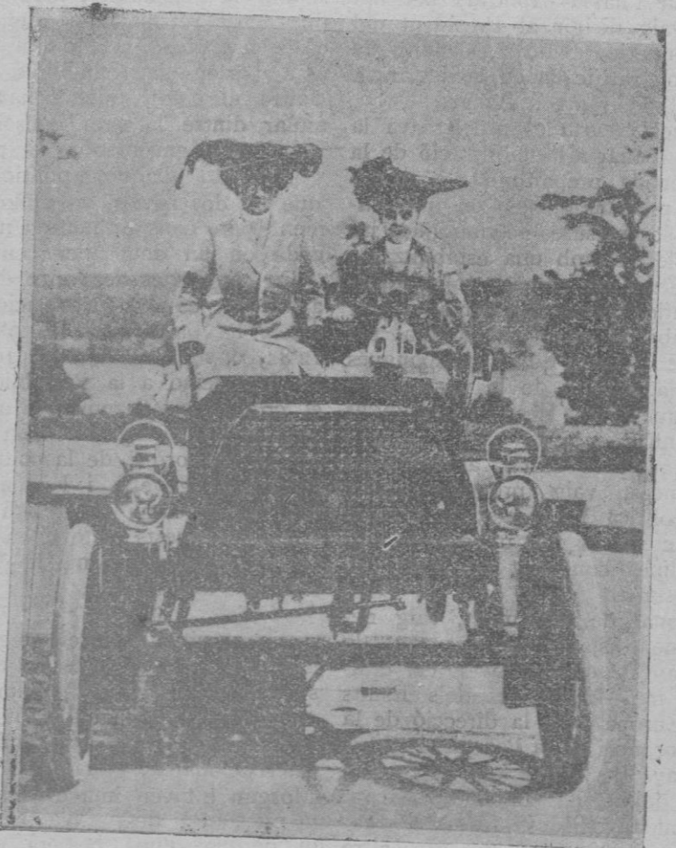
Londres.—Jóvenes motoristas inglesas que tomaron parte una fiesta automovilista en la que se exhibieron autos y modas del 1901

Biroteau, emocionadísimo, ofreció muy cortesmente una gratificación al empleado, y éste, después de varias negativas formularias, terminó por guardarse los quinientos francos de Biroteau.