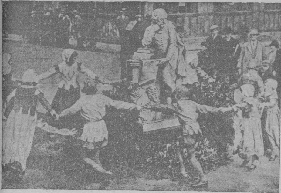
Niños vestidos con trajes de época danzan ante la estatua del autor de «Hamlet», con motivo de la inauguración del nuevo teatro de Stratford