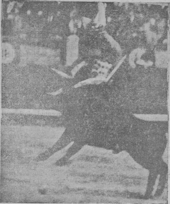
En la plaza de Madrid fué cogido el domingo, recibiendo una grave herida en un muslo