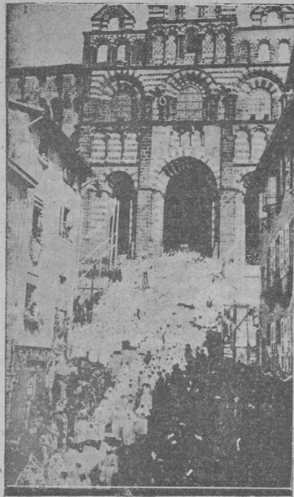
Puy-en-Velay (Francia).—Un gentío inmenso y numerosos cardenales y obispos asistieron a las fiestas religiosas celebradas con motivo del 29 jubileo de Notre-Dame-du-Mont-Anis. La procesión saliendo del templo para dirigirse al santuario de la Virgen, situado en lo alto de la montaña