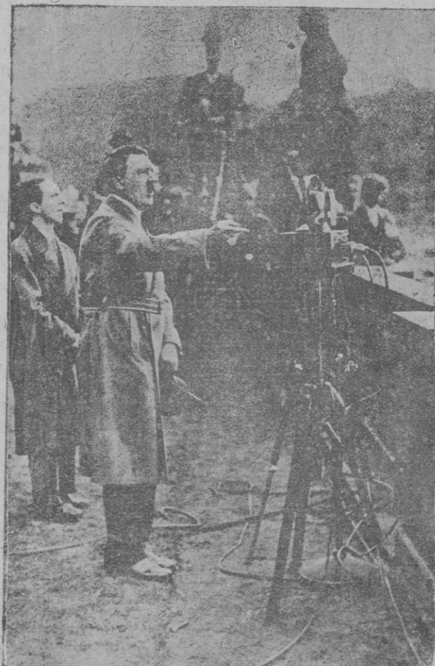
He aquí la figura que preocupa a todo el mundo. Hitler ha sido derrotado por Hindenburg en las elecciones a la Presidencia del Reich, pero los 13 millones y medio de votos que ha obtenido Hitler demuestran que su poder es grande ya que los demás partidos coaligados, excepto el comunista, han obtenido 19.700.000 votos, por lo que de un momento a otro puede mandar en Alemania