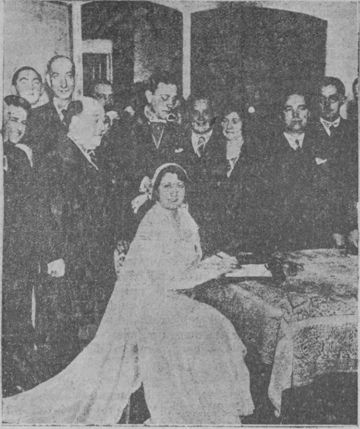
La primera actriz Isabel Barrón al firmar el acta matrimonial con el primer actor Ricardo Galache. Junto a la novia, el actor cómico Pepe Portes. Estos artistas al frente de su compañía debutarán en el Teatro Principal el 29 del corriente