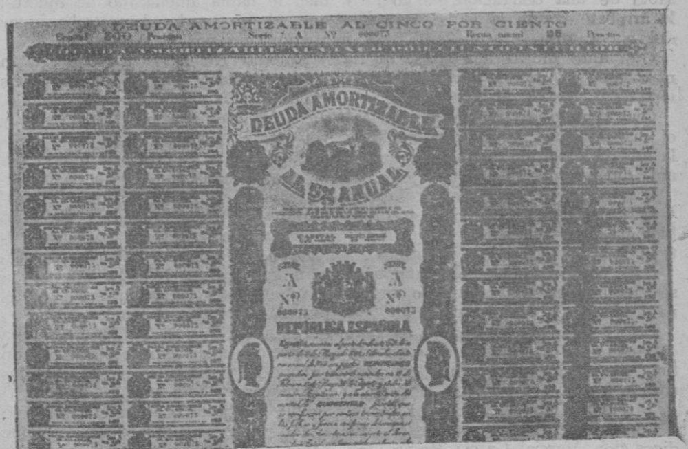
Ejemplar de los títulos de la Deuda amortizable al cinco por ciento, y son los primeros también que llevarán los emblemas de la República.