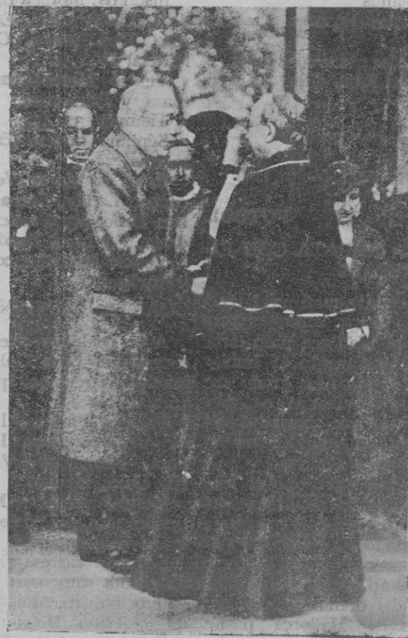
El cardenal arzobispo de Sevilla, señor Ilundain, al despedir al jefe del Gobierno a quien cumplimentó durante su visita a la iglesia catedral