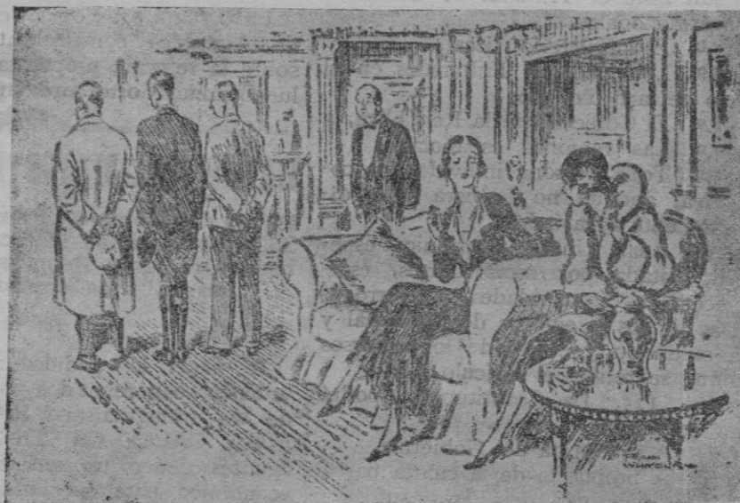
La señora (que va a tomar nuevo chófer, a su amiga).— Siempre lo elijo por la espalda; porque, después de todo, es lo único que tengo que mirar la mayor parte del tiempo.