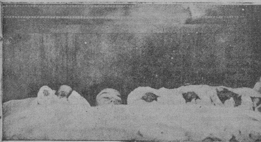
La vecina de Lebrija que, en estos tiempos de paro forzoso, ha dado a luz cuatro criaturas