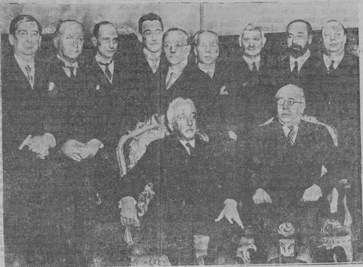
Los nuevos Ministros con el Sr. Alcalá Zamora durante la visita que realizaron al Presidente de la República