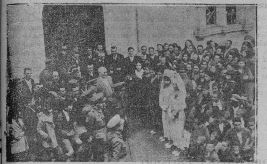
El Comandante general Sr. Cabanellas acompañado del Alcalde de Alcudia, saludando a las Madrinas.