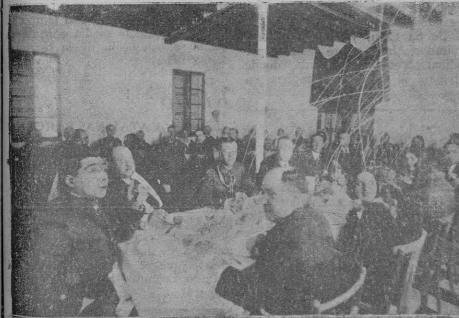
Banquete celebrado en el Hotel Miramar el día de la entrega de las banderas.

vieron a sus niños en el hogar y el Maestro vió las aulas casi vacías. Huelgan, como decíamos antes, los comentarios. Basta que el lector compare el modo de obrar de uno y otro Consejo.