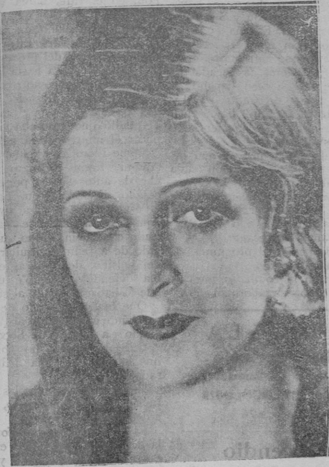
La famosa estrella de la pantalla que ha fallecido víctima de una infección, que degeneró en pulmonía