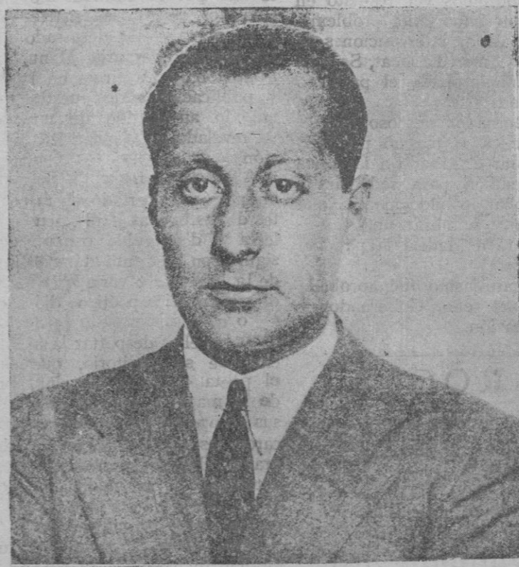
El hijo del Marqués de Estella que fué detenido con motivo del complot de que se habla estos días, y puesto en libertad a las pocas horas

la libertad, para recuperar su lugar a la cabeza de las naciones.