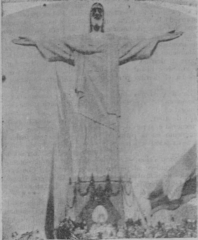
Colosal estatua de Cristo Redentor, de cuarenta metros de altura, que se yergue en el Cerro Corcovado, dominando la ciudad de Rio de Janeiro, cuya iluminación fué encendida por Marconi, desde Italia