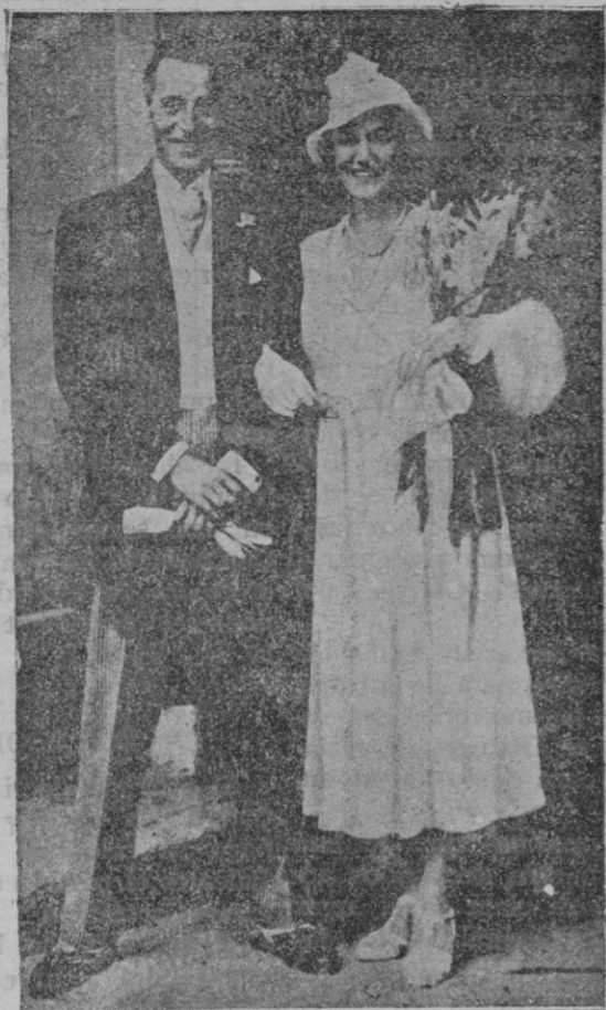
La famosa cantatriz Grace Moore y el actor español Valentín Parera, que han contraído matrimonio en Cannes