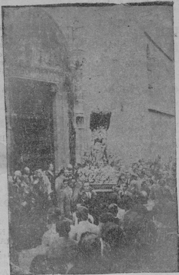
La venerada imagen al salir de la iglesia de San Miguel