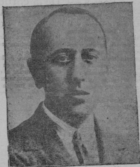
El abogado y diputado a Cortes don José María Gil Robles, que se ha encargado de la defensa de los generales que constiuyeron el primer Directorio militar