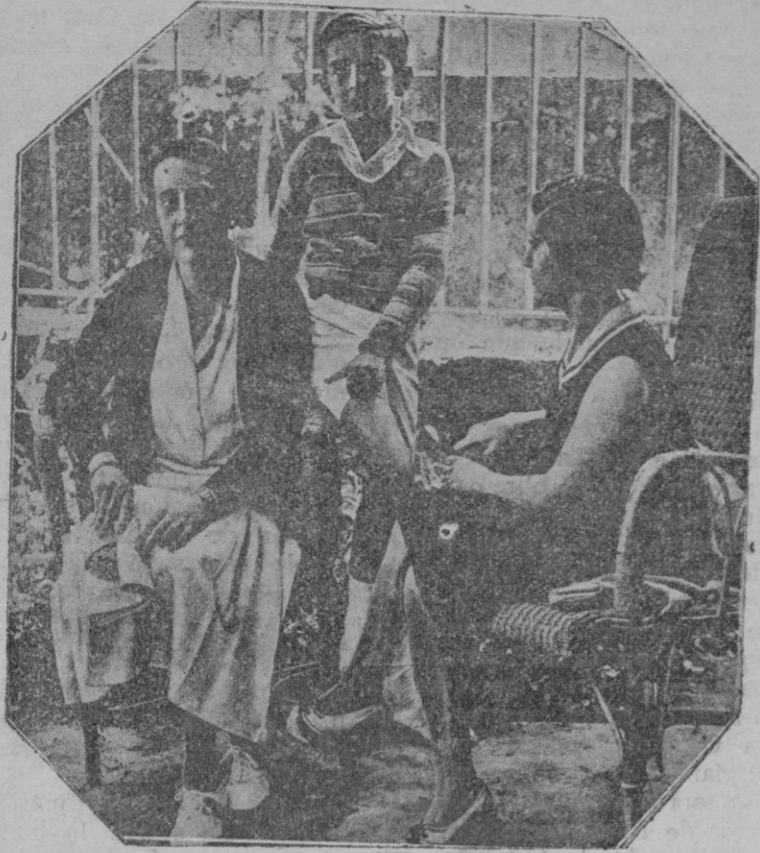
La esposa del Ministro de la Gobernación, hablando con una redactora de «Estampa»