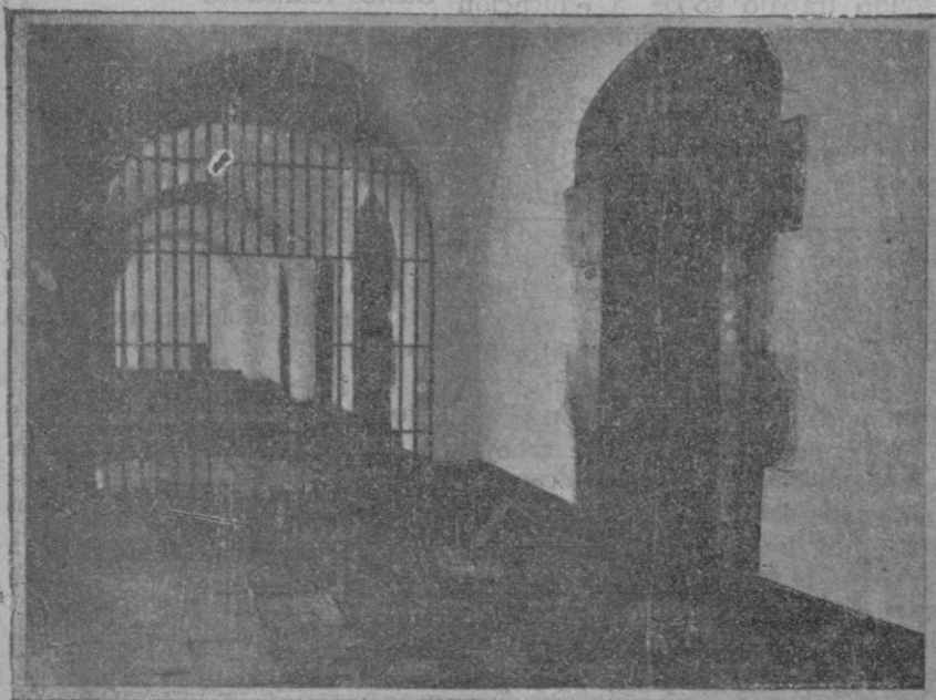
Las celdas del castillo destinadas a los detenidos