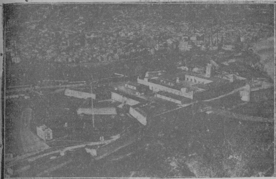
El castillo, que el Estado ha cedido al Ayuntamiento de Barcelona, visto desde un aeroplano