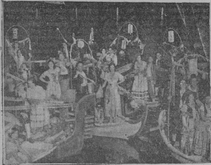
Grupo de góndolas de la fiesta veneciana celebrada en el Reetiro, organizada por el Círculo de Bellas Artes