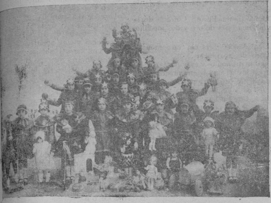
Un grupo de alumnas de dicha acreditada Escuela representando un bonito árbol de Navidad