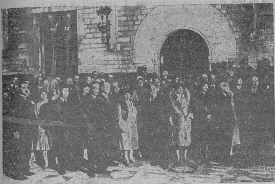
Los socios del Automóvil Club de Munich que vinieron a nuestra ciudad días pasados