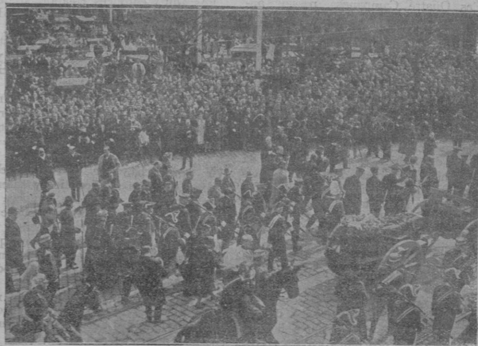
El paso de la fúnebre comitiva por las calles de Madrid, que presenciaron muchos miles de personas